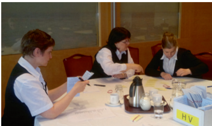
Starfsfólk á Grand Hótel vinnur færnigreiningu.