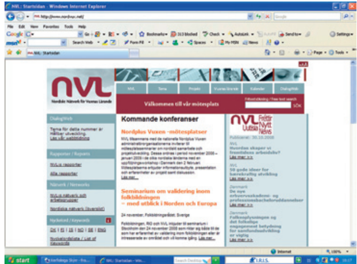
Heimasíða NVL, www.nordvux.net .

Það kemur skýrt fram í stefnu FA að stofnunin ætli ekki að starfa beint með markhópnum heldur að starfa með og styðja við þá sem eru í beinum tengslum við markhópinn. Þannig hefur Fræðslumiðstöðin stofnað til tengsla við sérfræðinga og stofnanir sem vinna á ýmsan hátt að fullorðinsfræðslu og að málefnum sem snerta markhópinn. Með því að kalla til fólks eða bjóða því til samstarfs nær stofnunin að eignast bandamenn á ólíklegustu stöðum. Vissulega eru flestir nátengdir fræðslumálum fullorðinna en þar fyrir utan má nefna verkstjóra og aðra stjórnendur í fyrirtækjum, sérfræðinga hjá stéttarfélögum og öðrum félagasamtökum atvinnulífsins sem boðið er að taka þátt í ýmsum verkefnum sem tengjast námi fullorðinna. Allt þetta fólk verður ósjálfrátt sendiherrar FA en ekki síst málefna sem stofnunin hefur tekið að sér. Það má því færa fyrir því sannfærandi rök að þeir hinir sömu virki sem málsvarar margra þeirra málefna sem Fræðslumiðstöðin stendur fyrir og auki þannig áhrifamátt stofnunarinnar.