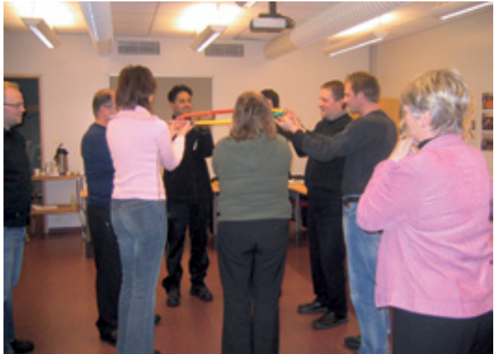
Mynd af námskeiði starfsþjálfra

talið bættu ráðgjöf, efla grunnþekkingu og samfélagsvirkni).