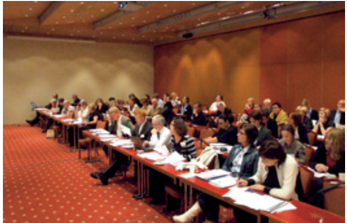
Mynd frá lokaráðstefnu VOW.

Stjórn verkefnisins er í höndum Spánverja. Sjá heimasíðu verkefnisins, creacproject.or .