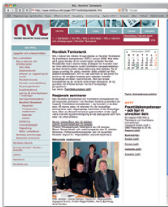
Mynd 1. Heimasíða NVL, http://www.nordvux.net/

NVL heldur úti öflugri heimasíðu, www.Nordvux.net . Þar eru upplýsingar um hvaðeina viðvíkjandi fullorðinsfræðslu auk upplýsinga um starfsemi NVL og vinnuhópa á þeirra vegum. Hægt er að leita að efni eftir leitarorðum á öllum Norðurlandamálunum og ensku. Þar er einnig að finna bæði rafrænt fréttabréf NVL og tímaritið DialogWeb. Fréttabréfið er á finnsku og íslensku og ein útgáfa er á dönsku, norsku eða sænsku. Það kemur út ellefu sinnum á ári; fulltrúar landanna safna og miðla fréttum hver frá sínu landi. DialogWeb kemur út átta sinnum á ári á rafrænu