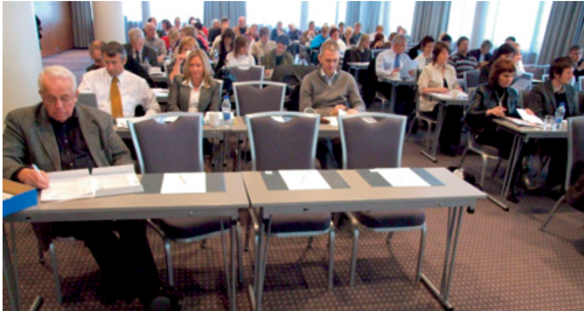
Mynd 4. Þátttakendur á norrænni ráðstefnu um raunfærnimat í maí 2007.