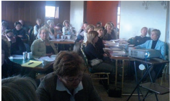
Frá námsstefnu um gæði í fullorðinsfræðslu á Kríunesi