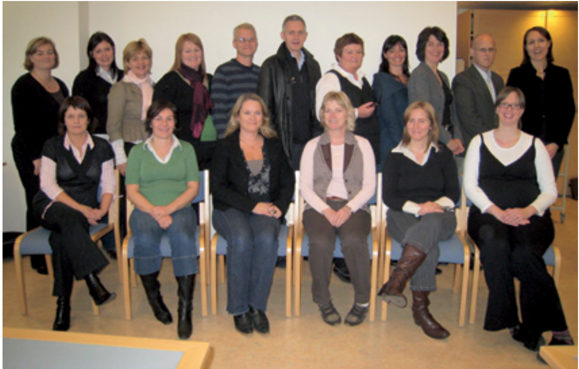
Mynd 4. Ráðgjafahópurinn á fræðsludegi

einstaklingar hafi þekkingu á eigin færni og þor til að þróa hana áfram. Náms- og starfsráðgjafar geta boðið upp á Færnimöppugerð fyrir einstaklinga og hópa. Þátttaka í slíku tilboði er skref í átt að virkri færniuppbyggingu.