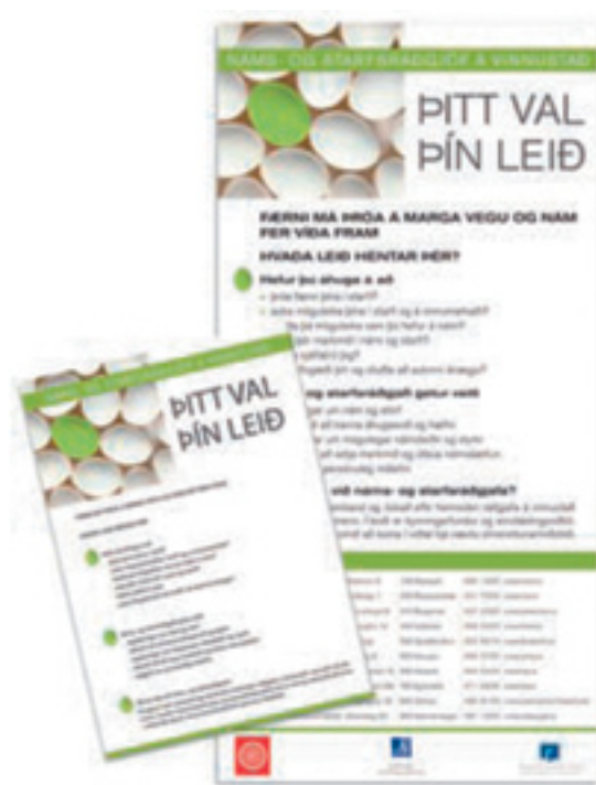
Mynd 3. Kynningargögn fyrir Náms- og starfsráðgjöf á vinnustað

Vandi, sem margir sem fást við fullorðinsfræðslu glíma við, er að finna leiðir til þess að hvetja fólk til náms. Ein leið, sem vert er að minnast á hér, er Færnimappan. Mímir – símenntun hefur boðið upp á færnimöppugerð sem gengur út á að einstaklingar skrá færni sína og safna saman gögnum henni tengdri í þar til gerða möppu. Það ferli, sem færnisráning af þessu tagi býður upp á, veitir einstaklingnum yfirsýn yfir þá færni sem hann hefur þróað með sér í gegnum hin ýmsu störf, nám, félags- og fjölskyldulíf. Það hefur sýnt sig að þeir sem fara í gegnum færnimöppugerð (einnig hluti af raunfærnimatsferlinu) finna margir hverjir fyrir innri hvatningu til áframhaldandi færniuppbyggingar. Að gera færnimöppu felur í sér sjálfsstyrkingu undir rétttri handleiðslu, sem ýtir undir sjálfsþekkingu og sjálfstraust til náms. Það er hagur einstaklingsins, fyrirtækja og samfélagsins að starfsmenn/