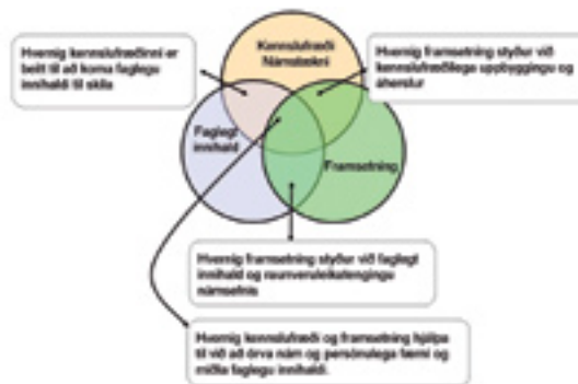
Mynd 2. Sviðin þrjú og skörun þeirra

Alltaf mun það verða afstætt hvað telst fullnægjandi samkvæmt lágmarkskröfum en viðmiðin í mælistikunni