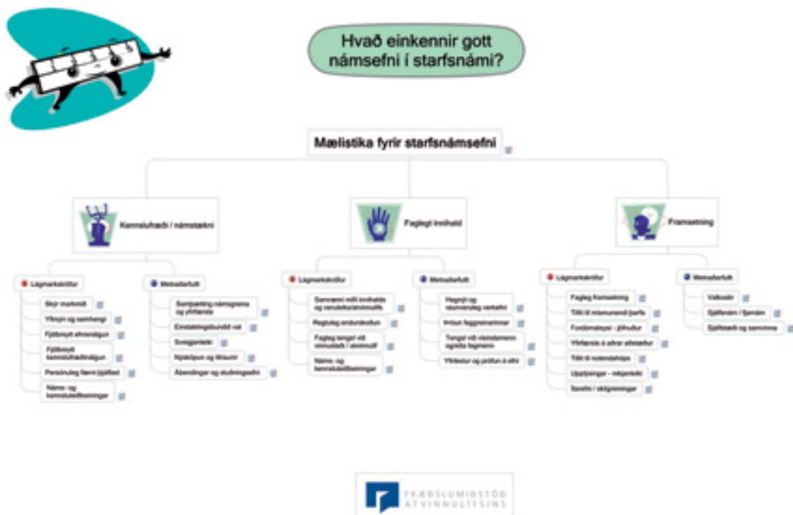
Mynd 1. Uppbygging mælistiku um námsefni í starfsnámi

Eins og sjá má á mynd 1 hér að neðan er með mælistikunni leitað svara við spurningunni: Hvað einkennir gott námsefni í starfsnámi?