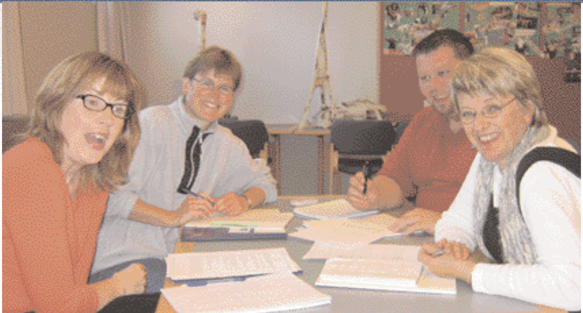
„Stundum þarf að aflæra gamla þekkingu og færni til að rýma til fyrir nýrri.“

beint sjónum að því sem betur má fara og vænlegt er til árangurs. Það skiptir miklu máli að móta fræðslustefnu og velja aðferðir sem hæfa nemendum og duga til árangurs, ekki bara við að afla þekkingar heldur til aukinnar lífsleikni.